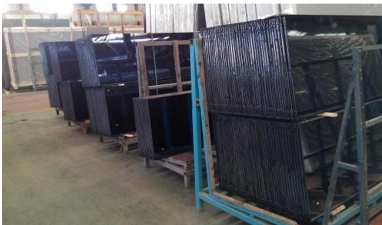
Vidro isolado reflexivo cinzento para Windows