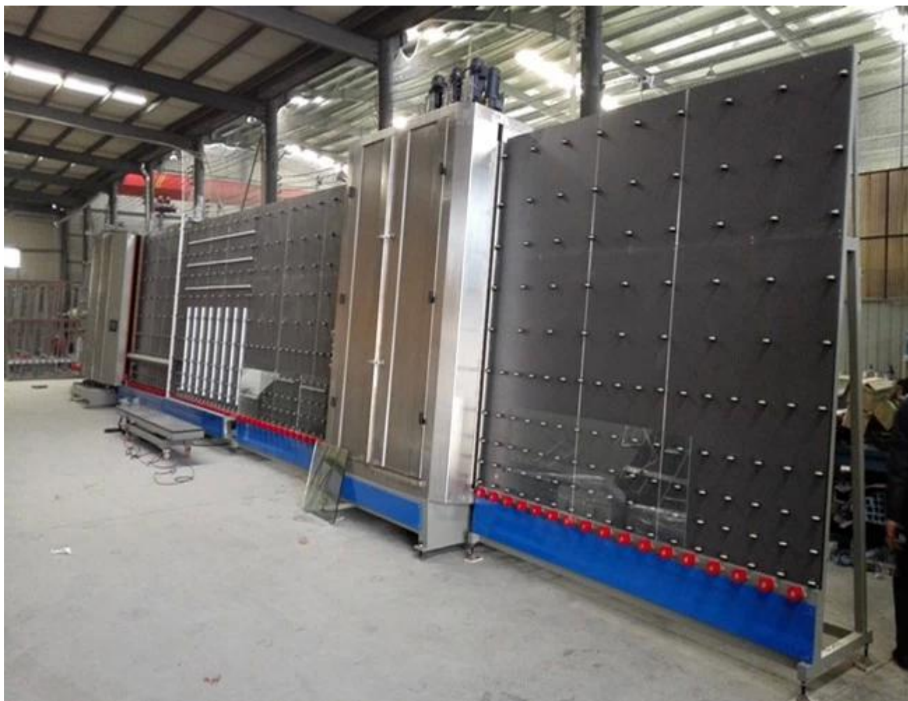
Forte pacote de vidro isolante