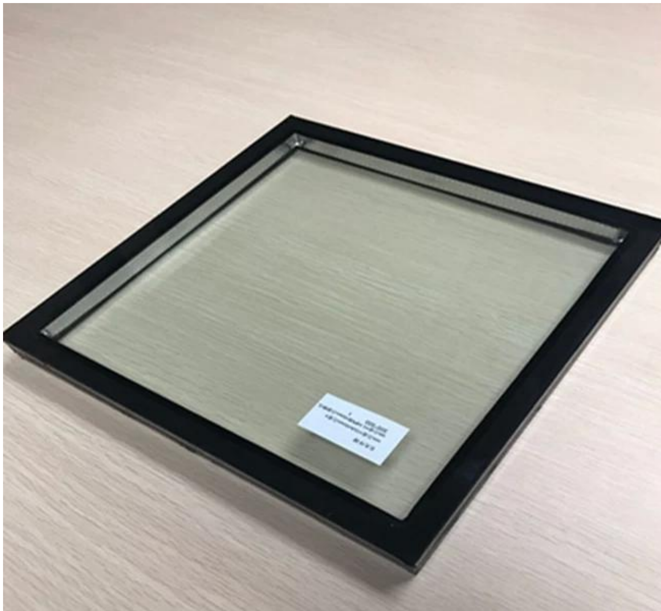
Linha de produção de vidros isolados