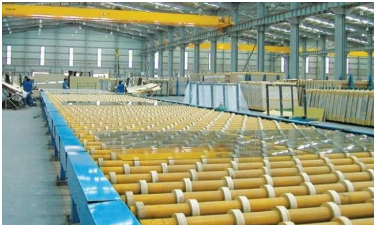
Float China embalagens de vidro