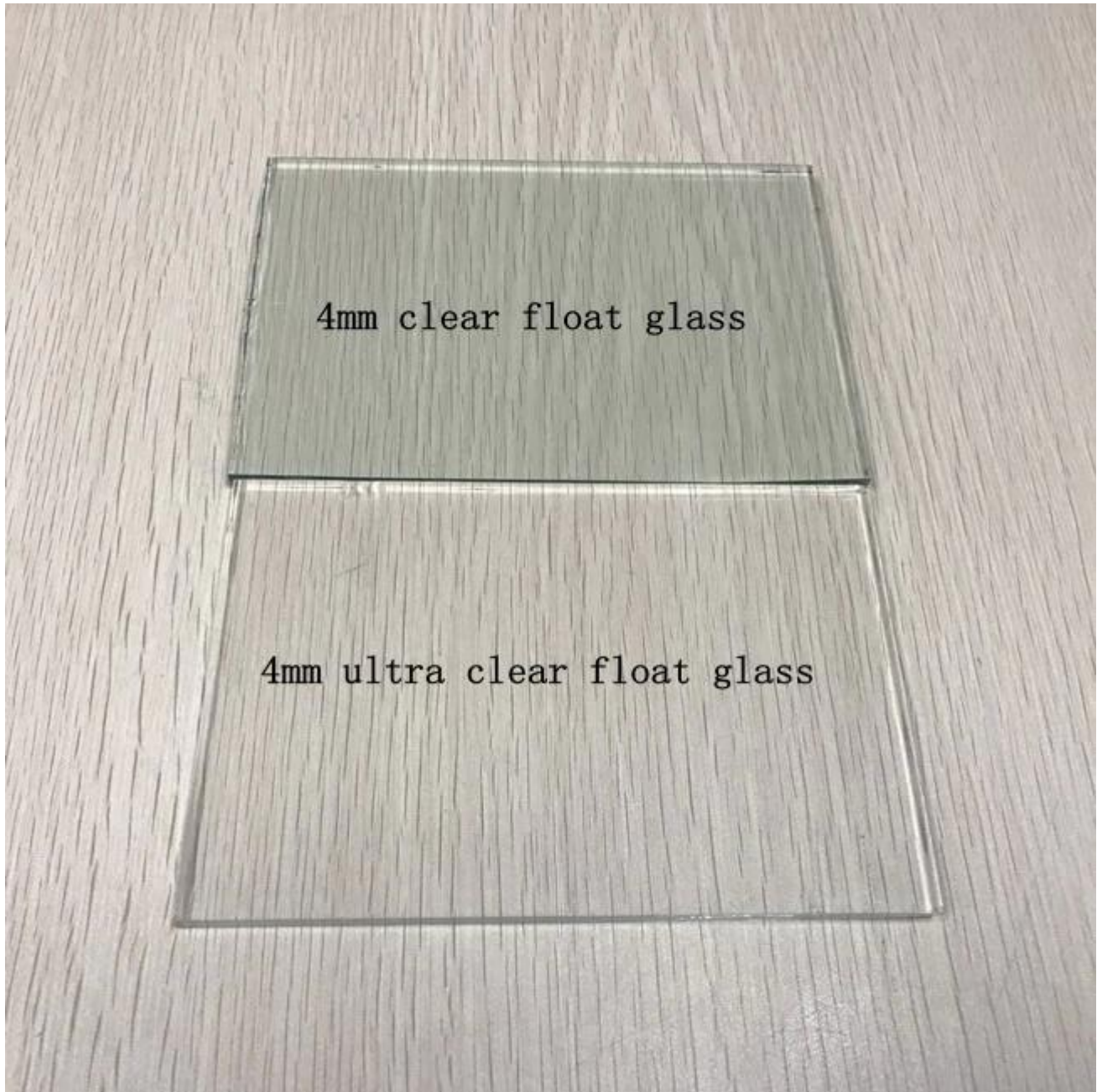
Vidro de flutuador Planta de produção