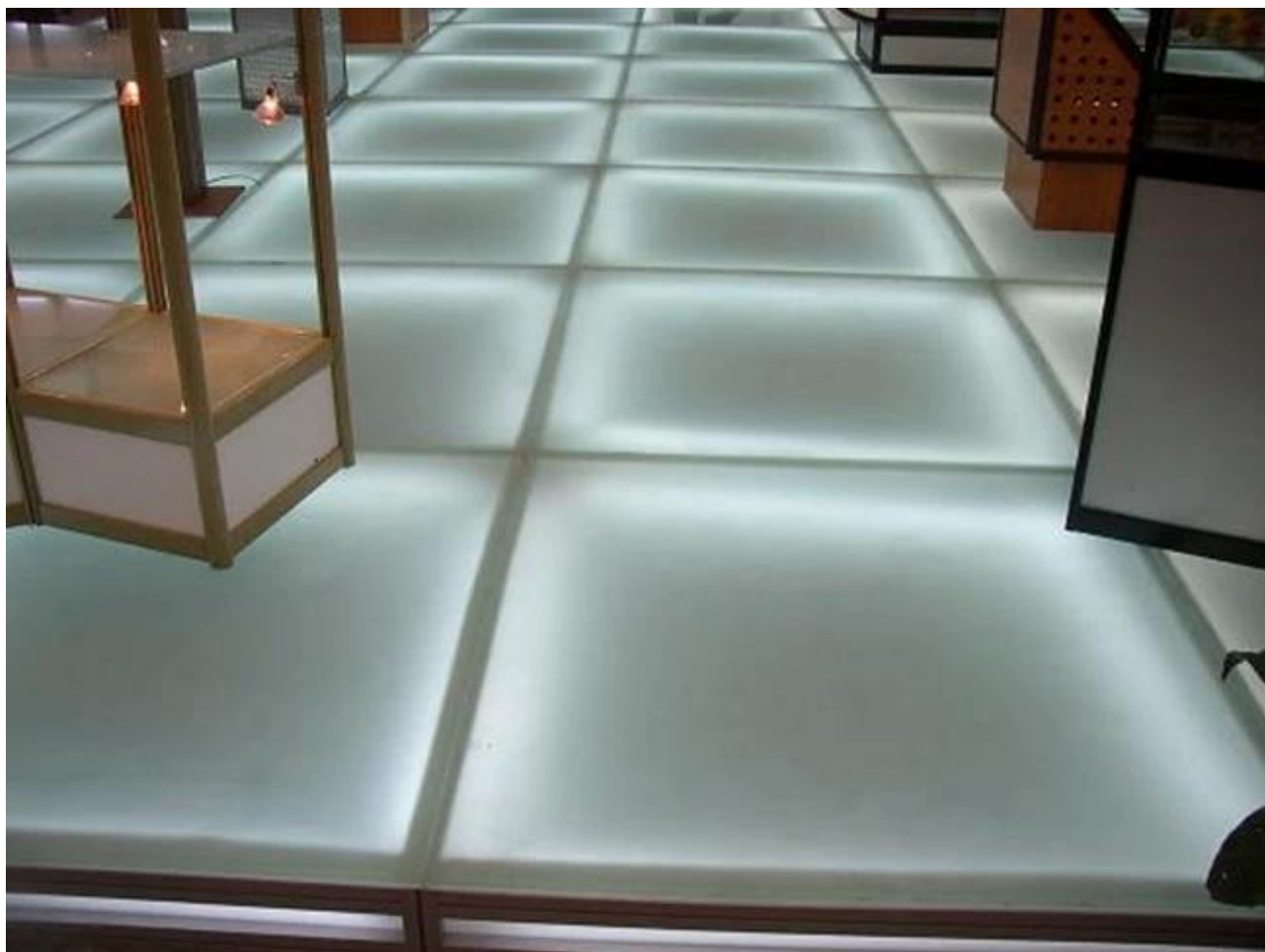
China JIMY tratamento especial antiderrapante vidro temperado para andar: