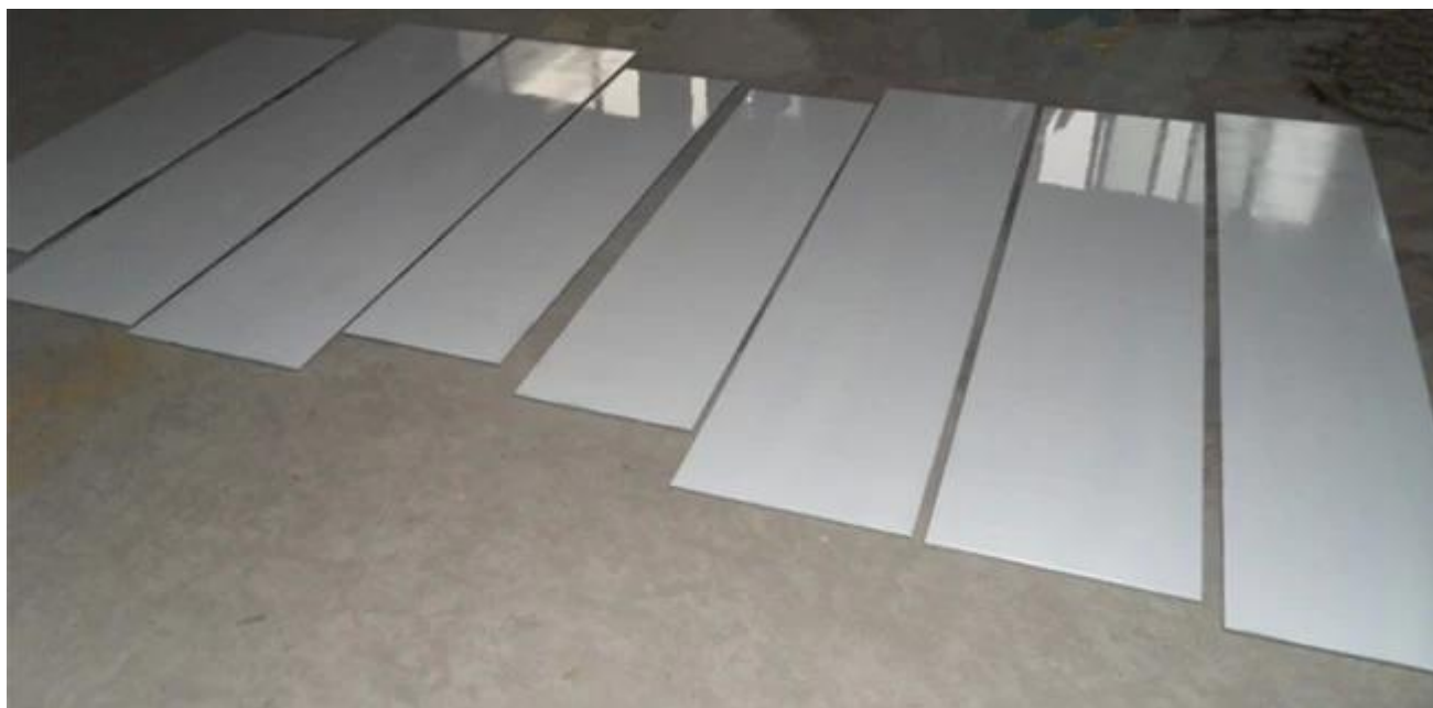
Cor diferente Vidro de laca: