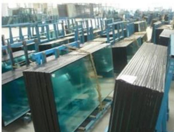
Vidro isolante laminado-reflexivo temperado: