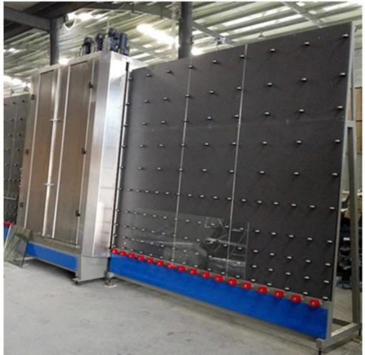
Armazém de vidro isolado