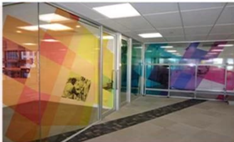
Aplicação de vidro temperado laminado PVB