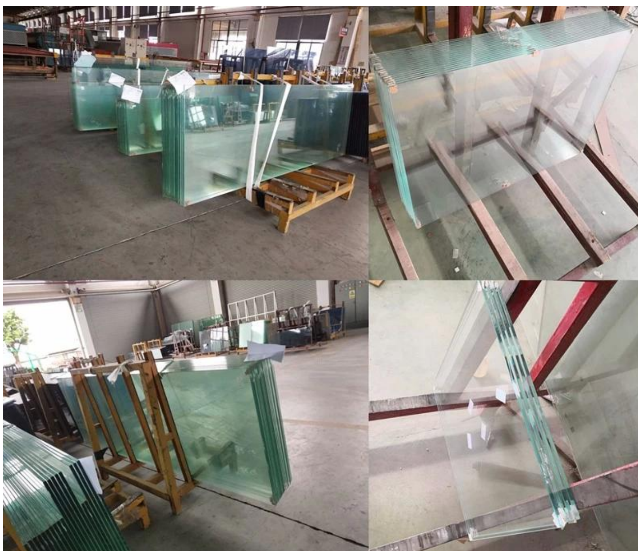
Alguns projetos foto partes de vidro temperado extra claro de 12mm