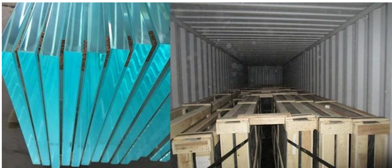
Algumas fotos sobre nosso vidro temperado super branco de 12mm