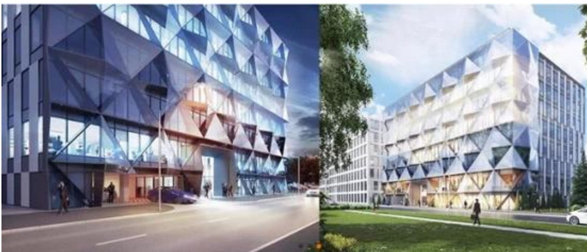
Vários desenhar forma triagngle vidro projeto