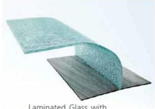
Laminated Glass with PVB Interlayer