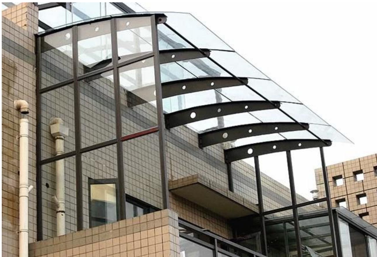
JIMY Fabrika Lamine Cam Ambar: