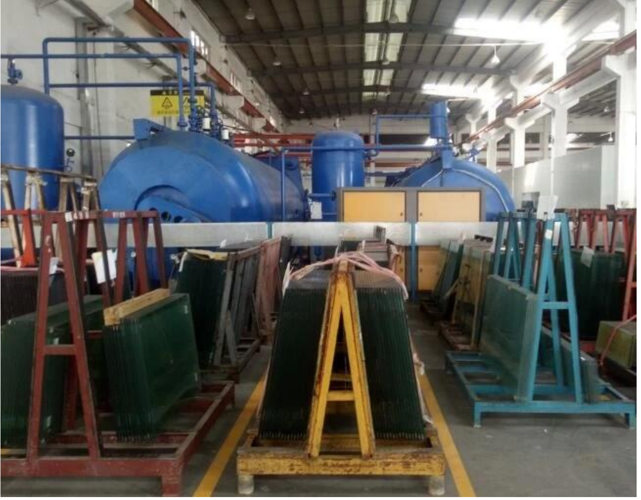
Kabı JIMY Glass Fabrikası ile Yükleme