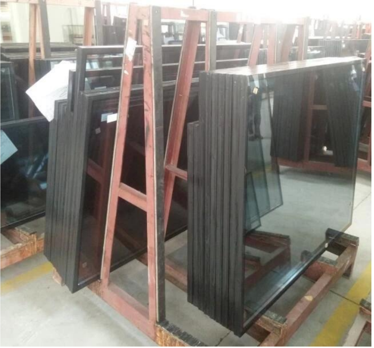
İzoleli Cam Üretim Hattı