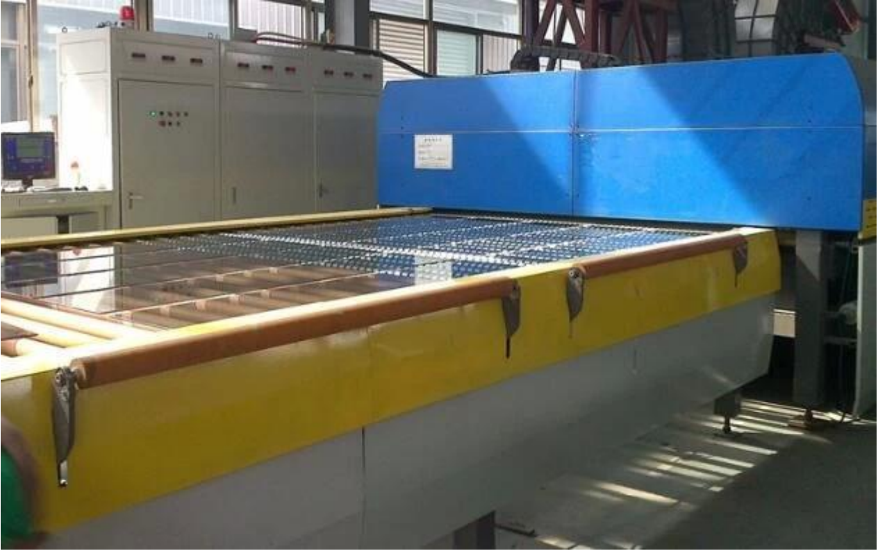
Jimy Glass Fabrikasında cam depo