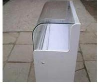
Bükülmüş cam fabrika ve Emanet yükleme