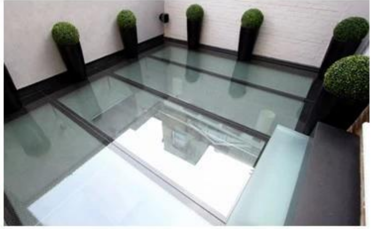
Kaymayan buzlu cam zemin uygulama: