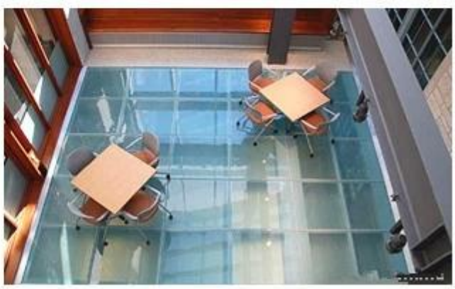
Emanet kat cam fabrika makine: