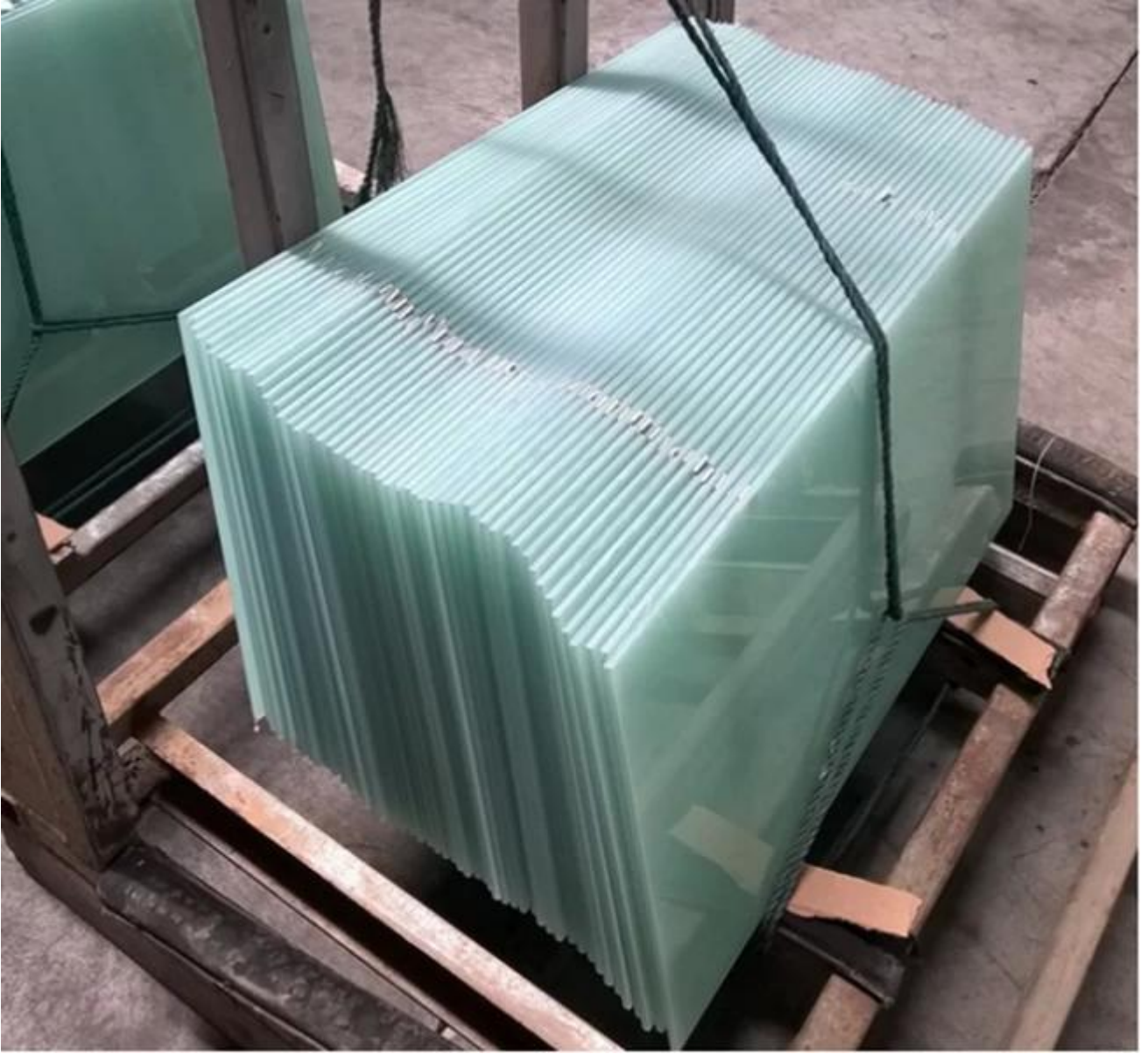
Lamine temperli bardak otoklavlama