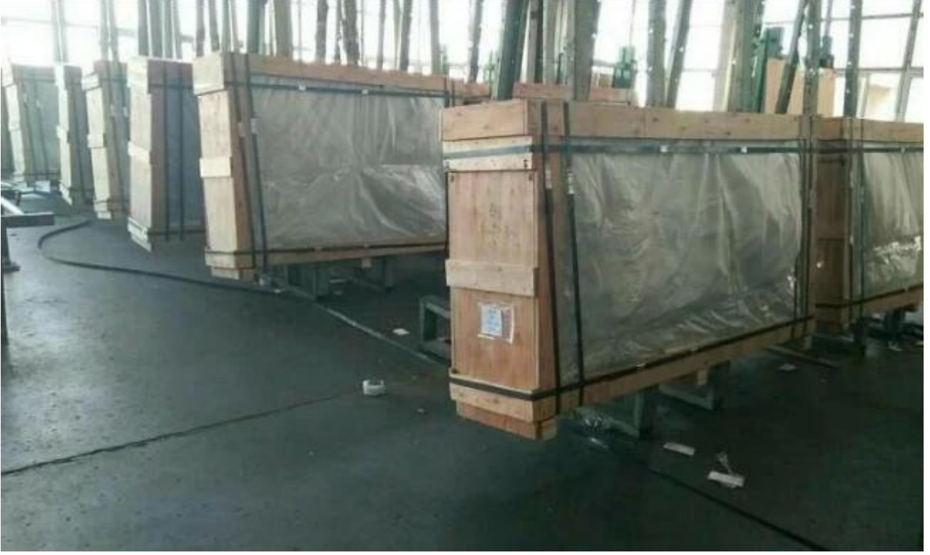
Jimmy cam fabrika tarafından konteyner yükleme