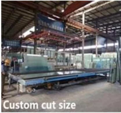
Custom cut size