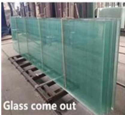
Glass come out