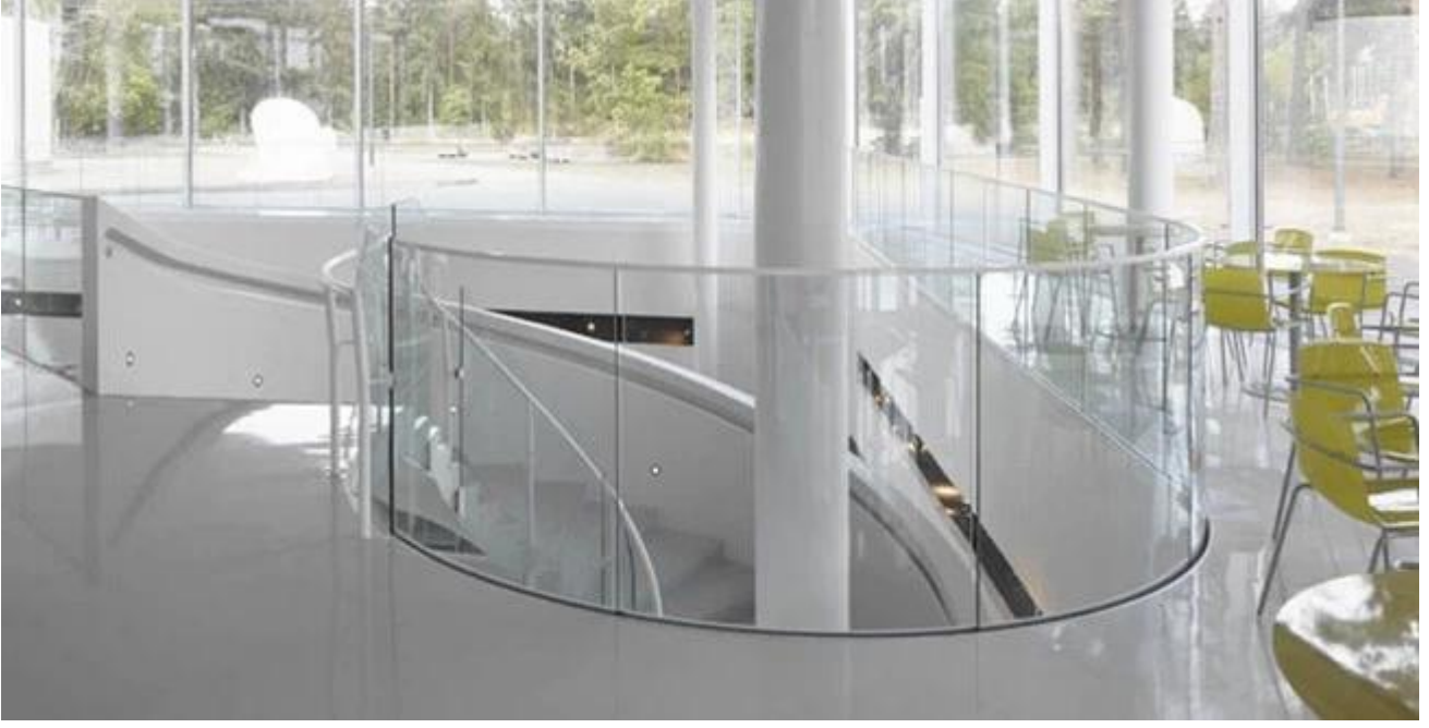
Çin temperli cam makine kavisli