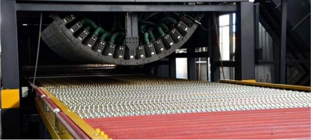
Çin cam Emanet yükleme kavisli