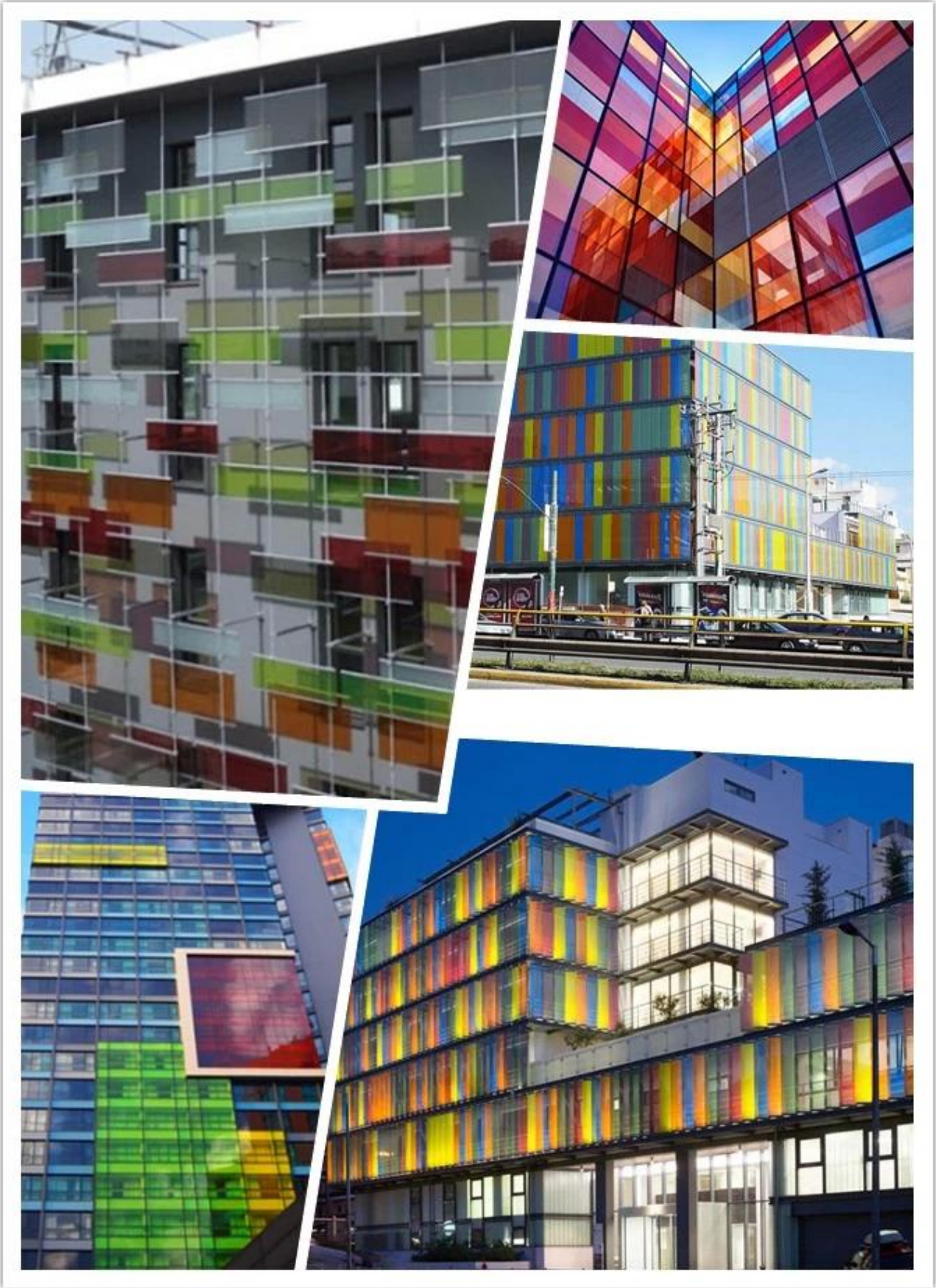
Saten yüzey renk pvb temperli lamine cam özellikleri