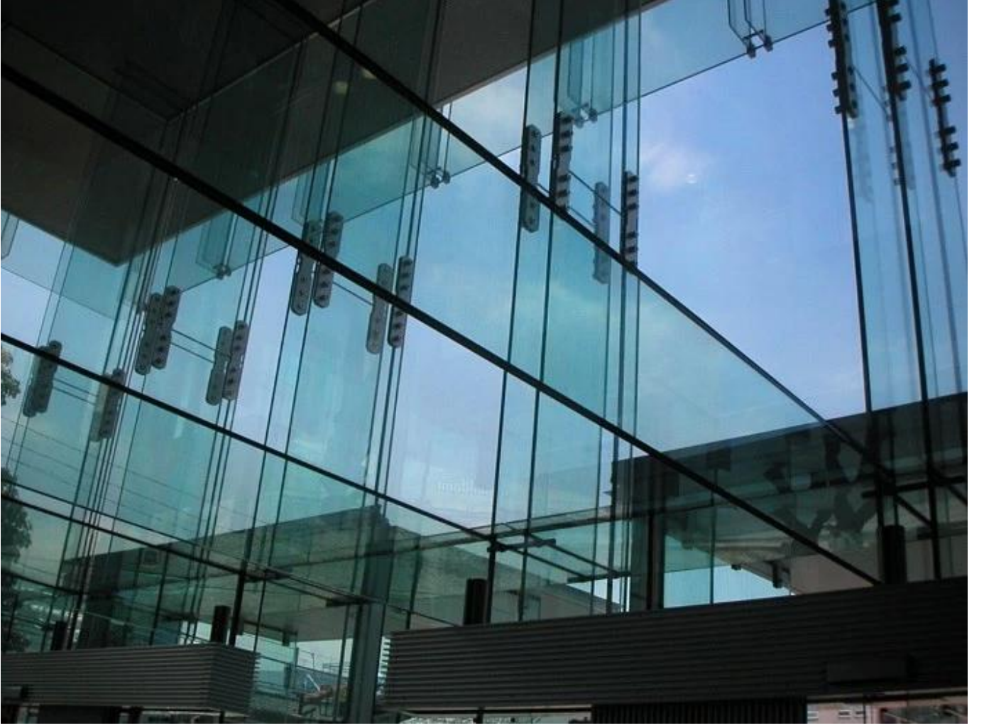
jumbo cam ölçüsü PVB lamine cephe camları için kompozit cam ürünleri.