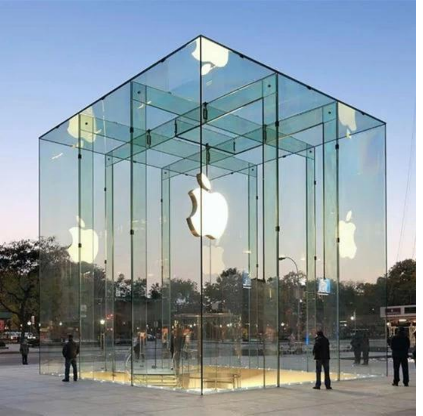
jumbo boy cam - 6 metre yüksekliğe sahip lobi camı.