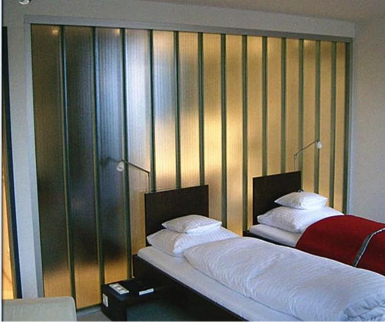
7mm U kanallı cam perde duvarı: