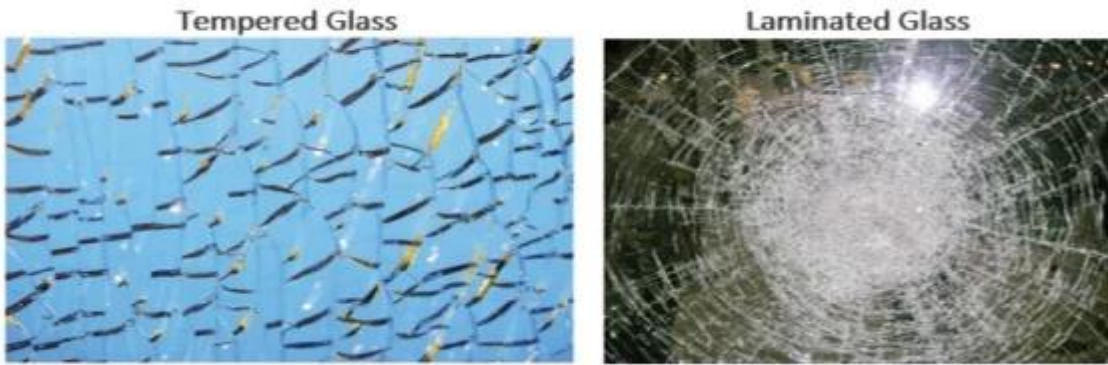
Laminated Glass Layers

Lamine cam temelde bir cam sandviçtir. İki veya daha fazla cam katından (arabanın ön camında olduğu gibi, isterseniz) arasına bir vinil ara katmanı (PVB SGP, EVA) olan camdan yapılmıştır. Cam bir arada kalma eğilimindedir ve bir tanesi kırılırsa, güvenlik camı olarak nitelendirilebilir.