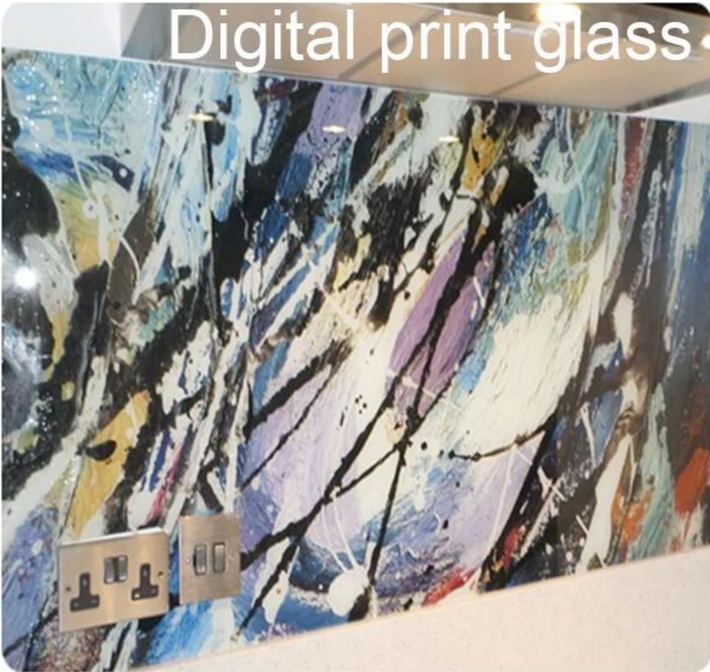
Digital print glass