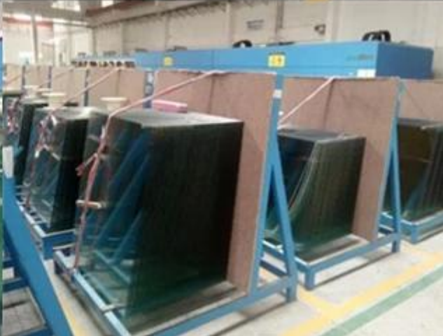
Đóng gói mạnh mẽ bởi Nhà máy Thủy tinh Jimy