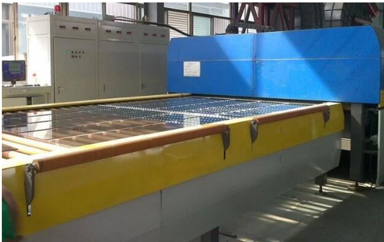
Nhà kho kính tại Nhà máy Jimy Glass