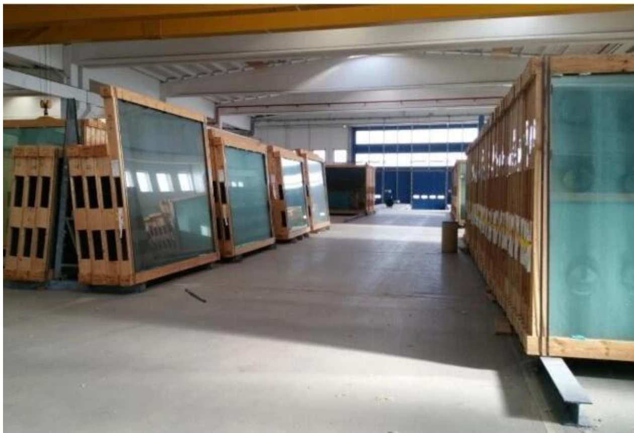
Kính để xếp container