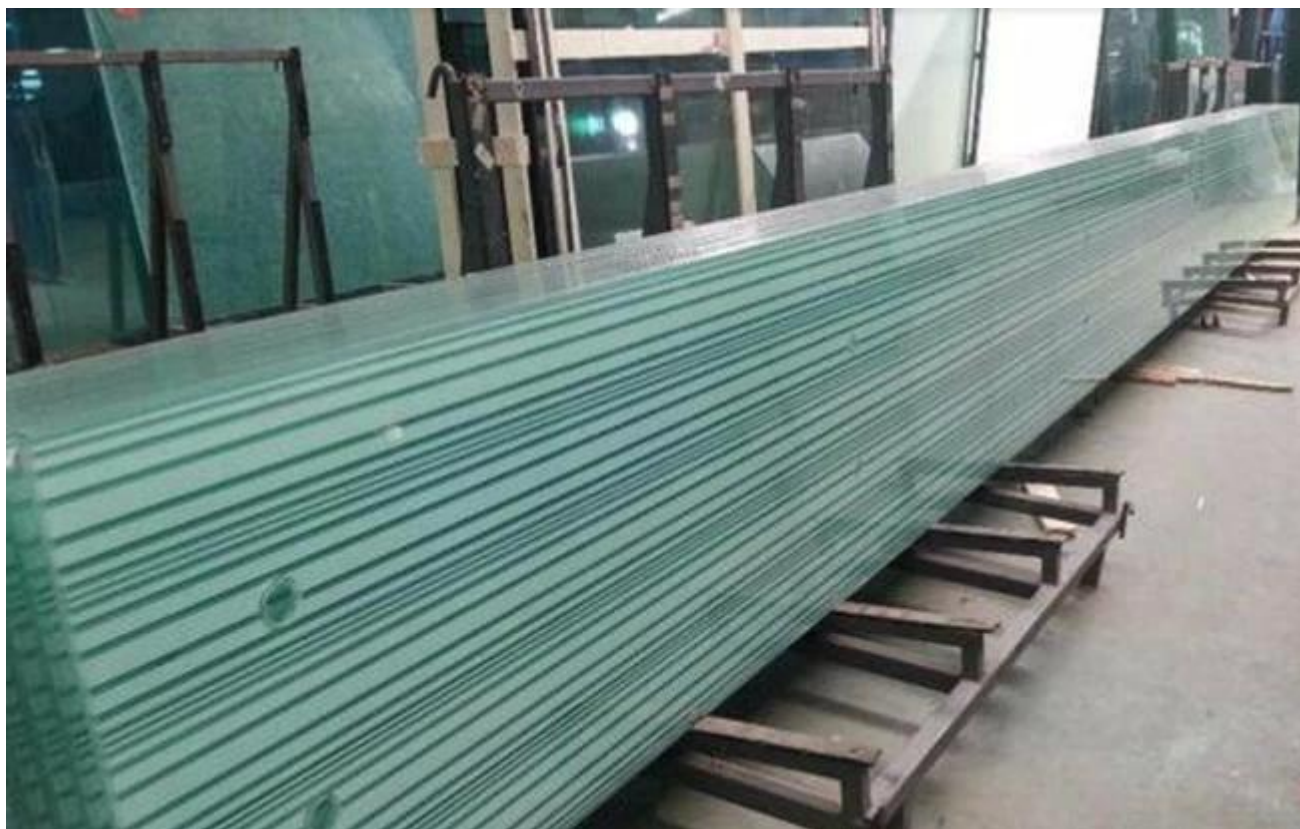
6 + 6mm màu xanh lá cây-Quảng trường màn hình lụa không lụa in được sử dụng cho balustrade