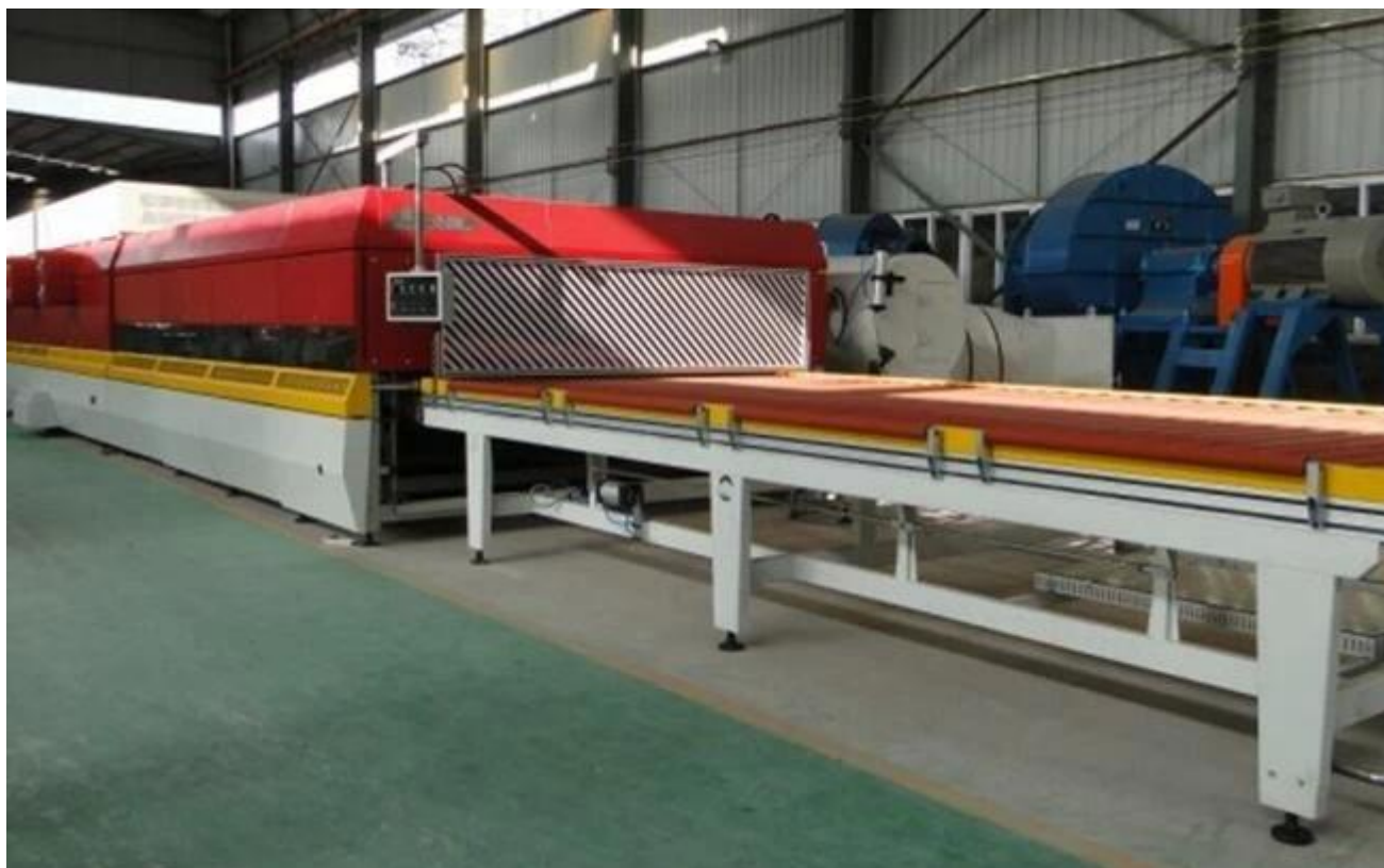
Tempered kính mạnh mẽ gỗ thùng bao bì và an toàn tải