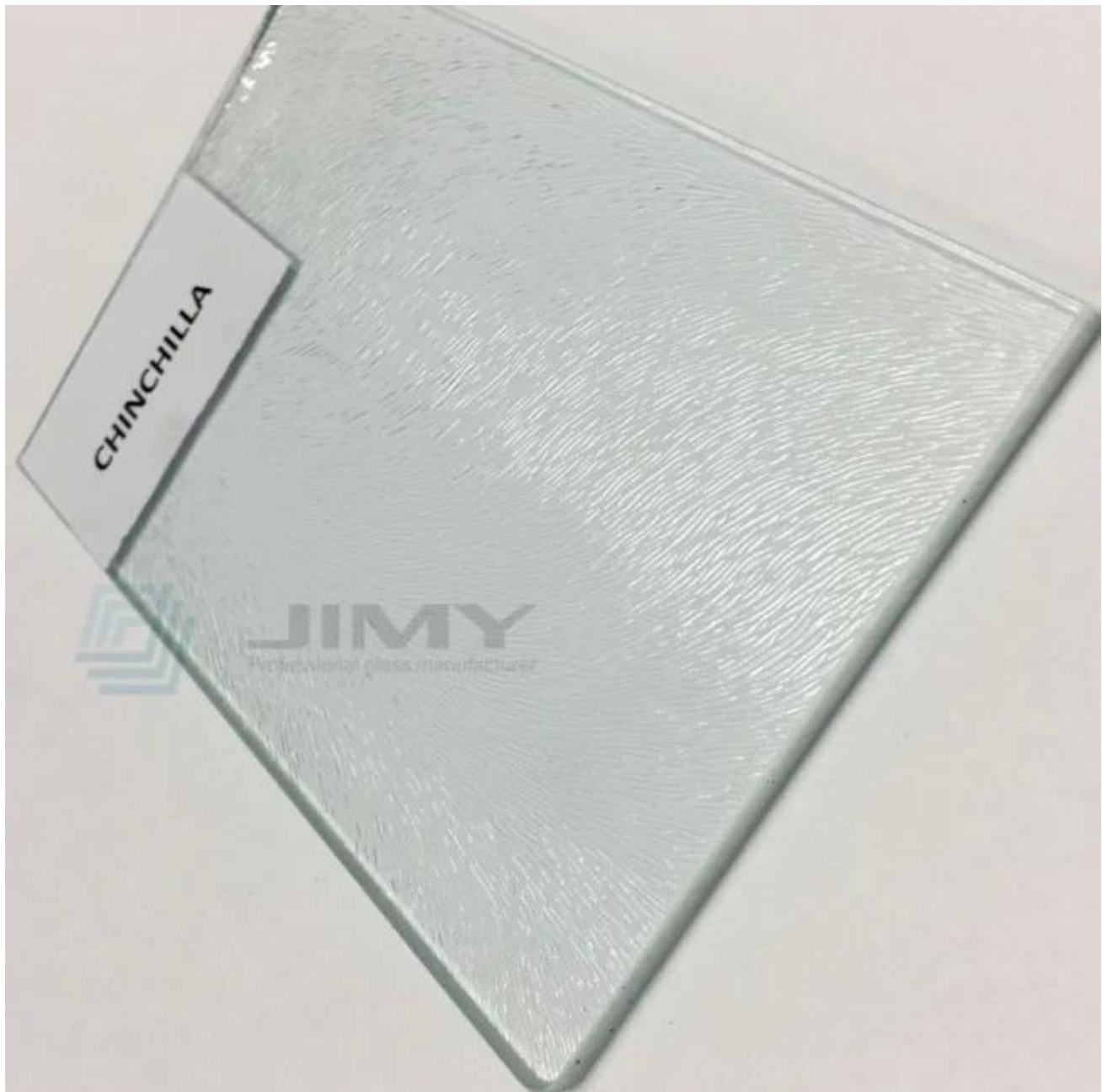
Kính thủy tinh 4mm rõ ràng từ Nhà máy Jimy Glass