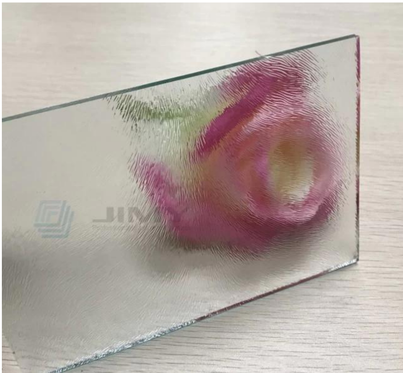
4mm rõ ràng Chinchilla figured thủy tinh