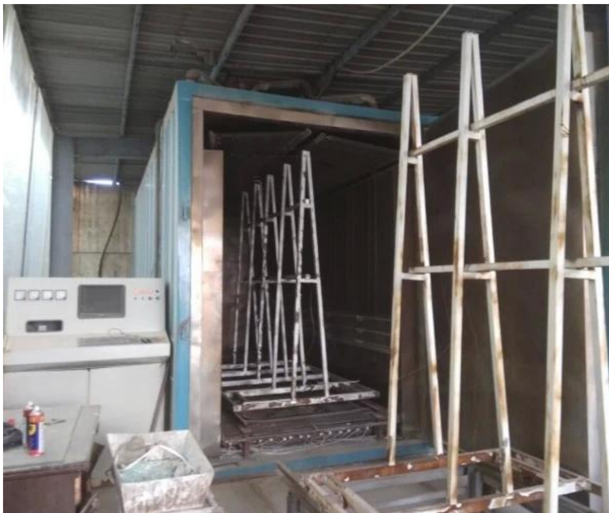
Kính thủy tinh luyện nhiệt chất lượng cao