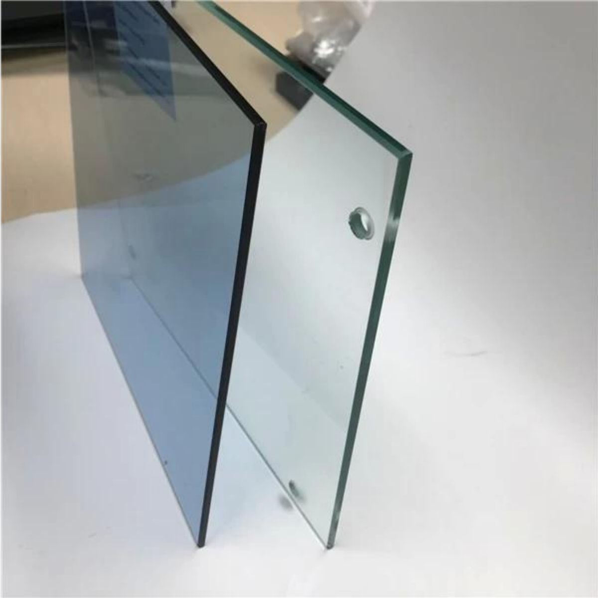
Kính thủy tinh chịu nhiệt