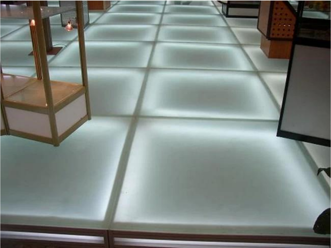
Trung Quốc JIMY chế biến đặc biệt chống trượt kính cường lực cho sàn nhà: