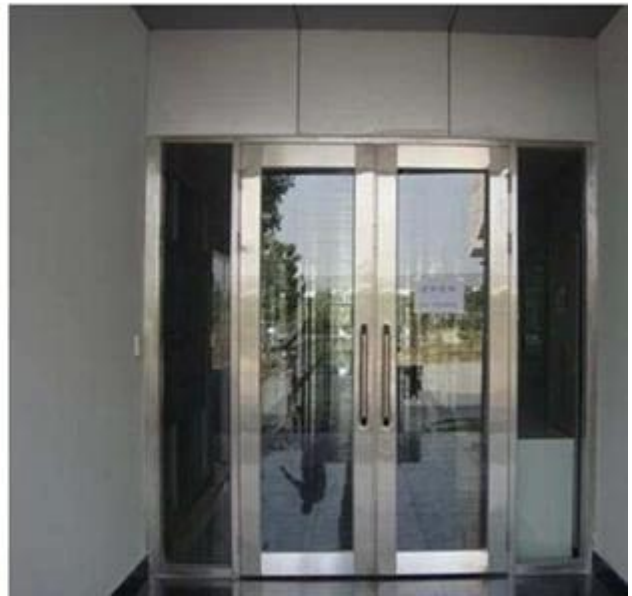
Kính cách điện chống cháy được sử dụng cho các tòa nhà phân vùng