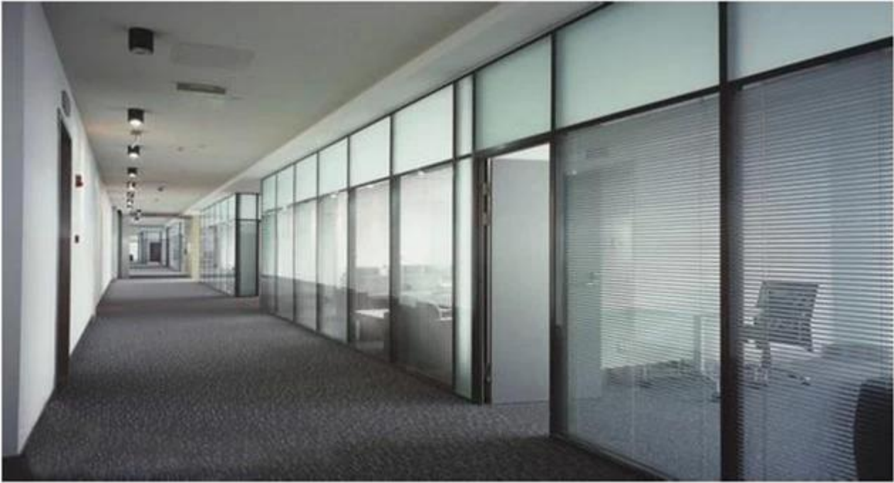
Nhà sản xuất thủy tinh cách nhiệt-chống cháy