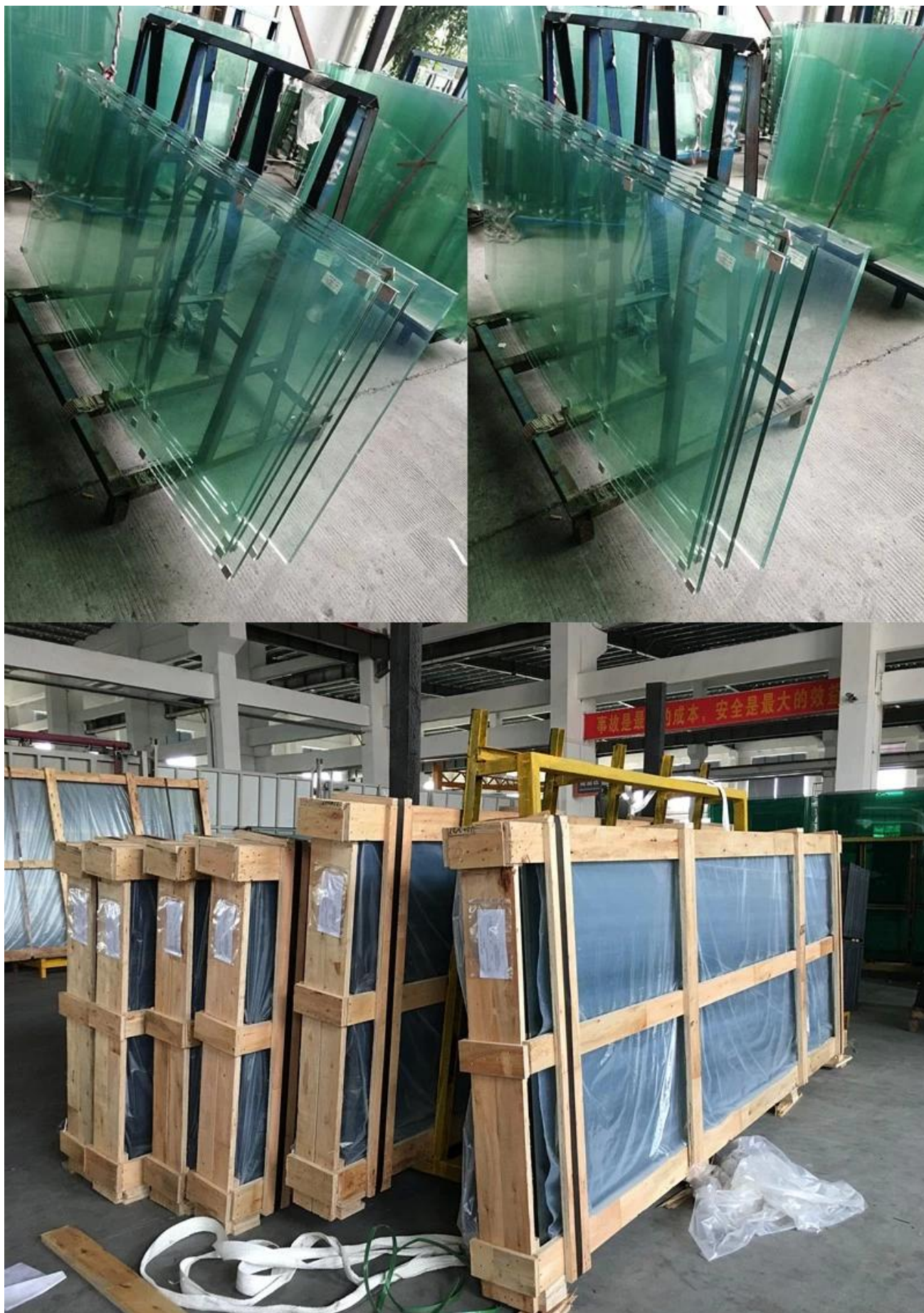
3-Đúng cách tải và sắp xếp công ty vận chuyển tuyệt vời để đảm bảo an toàn kính.