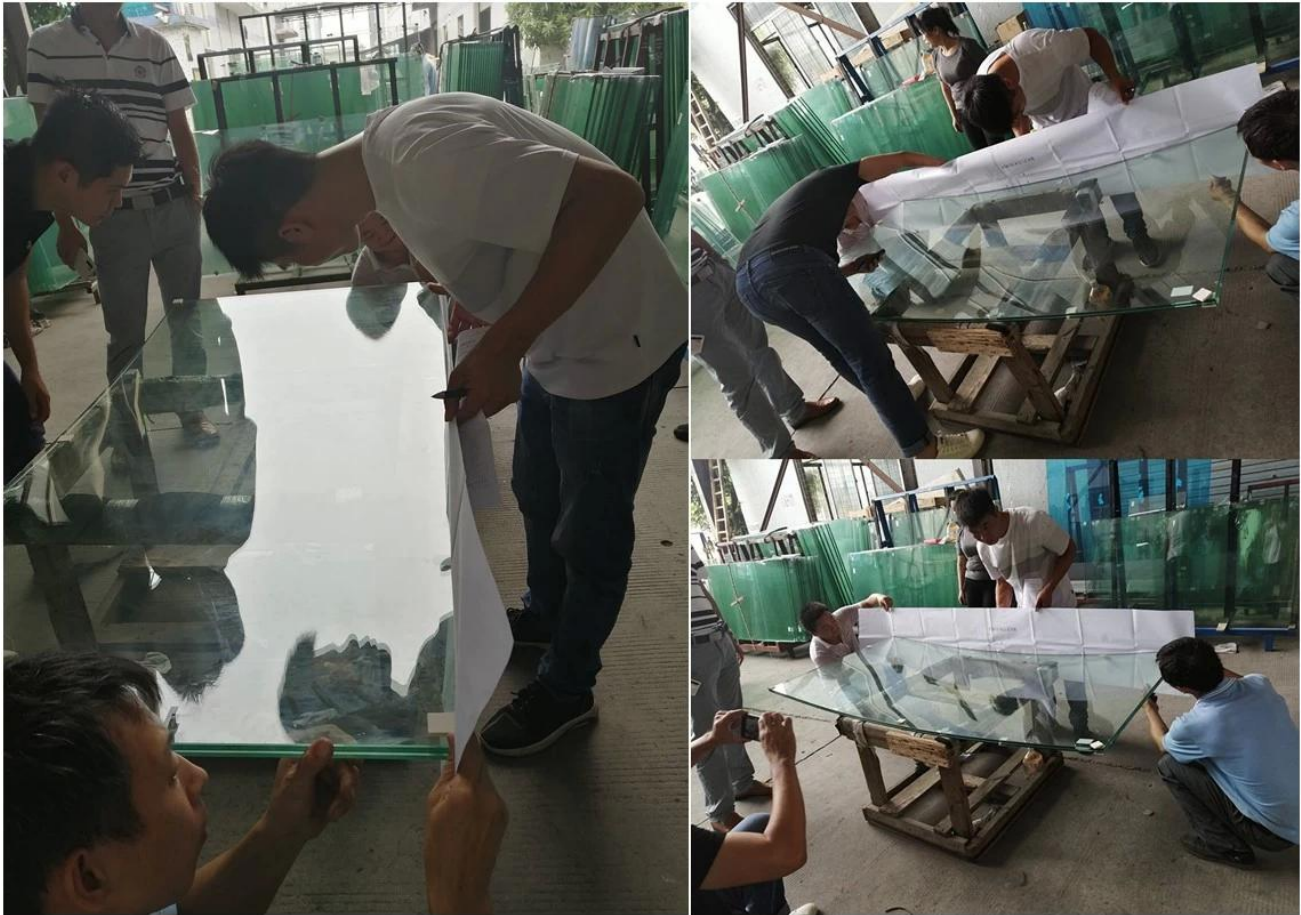
2-Giao hàng đúng hạn và đóng gói ván ép mạnh mẽ với nút chai hoặc giấy tuyết vôi để tách từng ly.