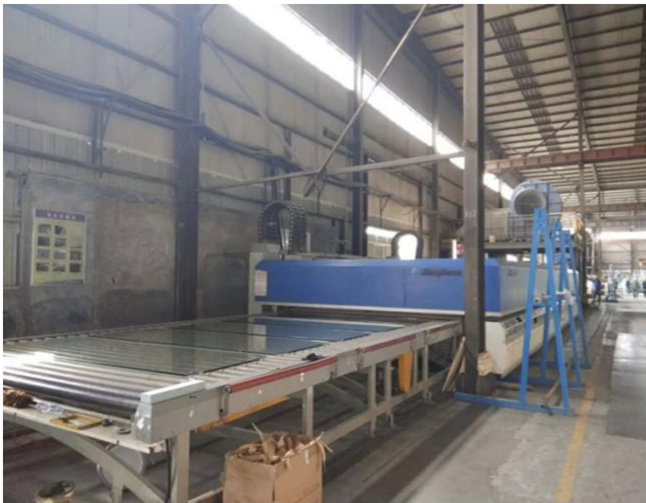
đóng gói công nóng tính ly