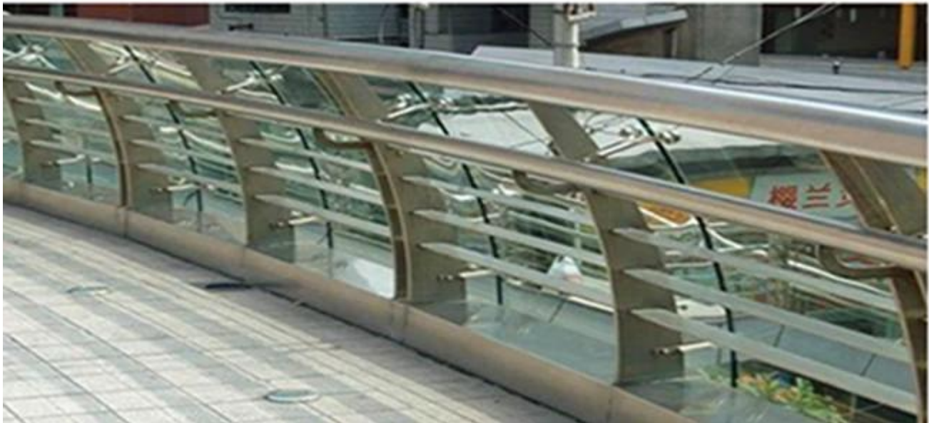
cong nóng tính ly sản xuất hàng