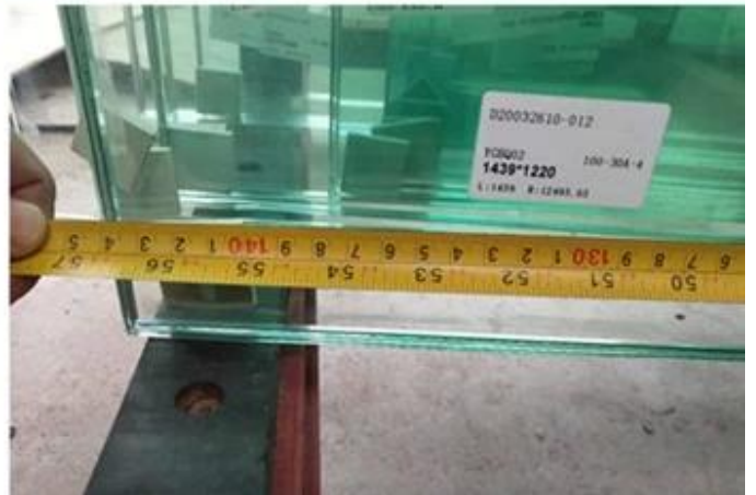
Cốc thủy tinh sự an toàn đóng gói và đang tải